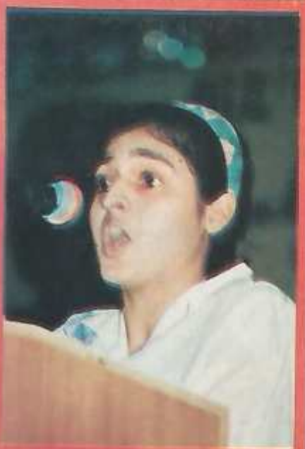
A girl speaker