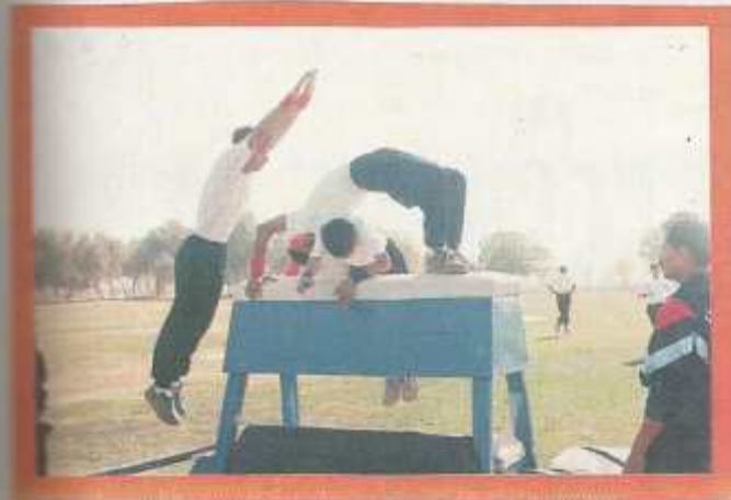
Gymnastics in progress