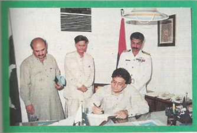
The Chief Minister in the Principal's Office