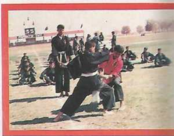
Martial Art display by cadets