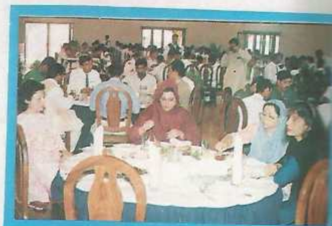
Guests in the New Mess