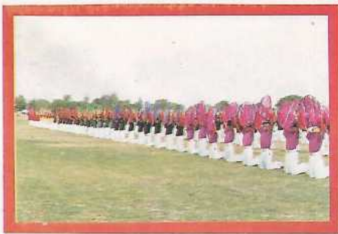
Junior Cadets displaying mass P. T.