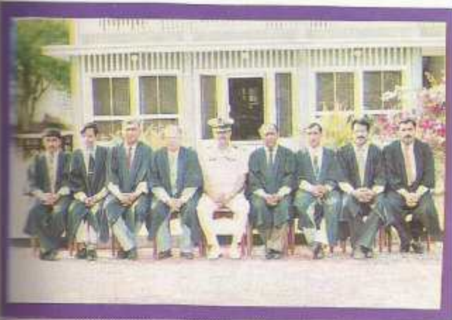
Department of English