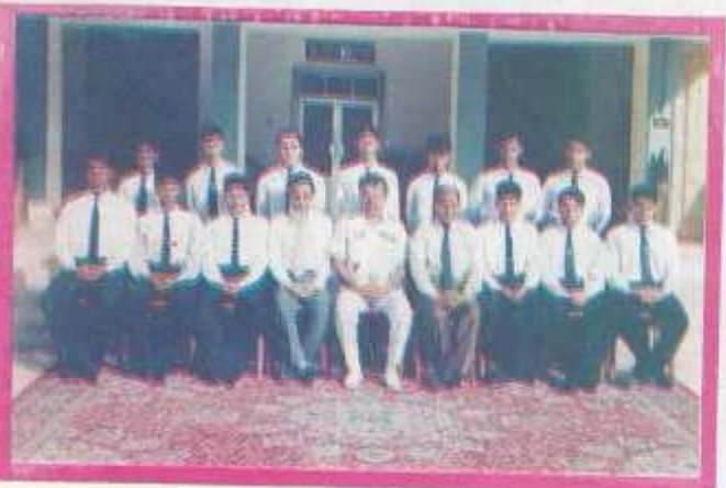
English Debating Society