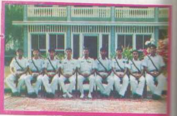
The college cross belts