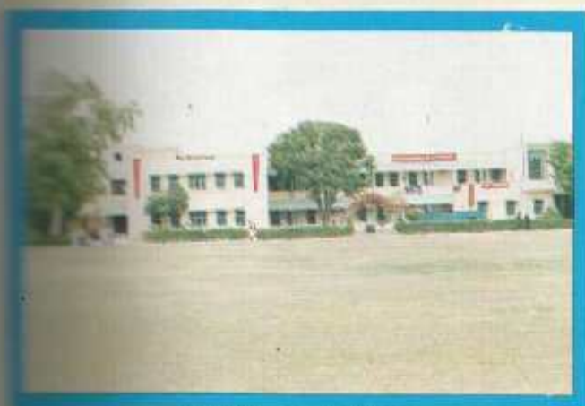
Latif and Ayub Division