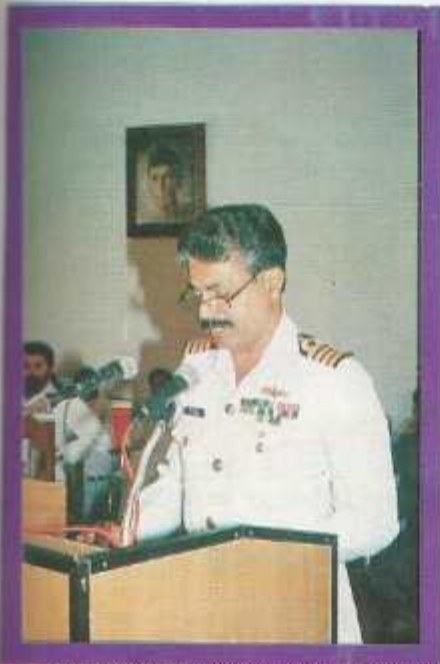
The Principal addresses the guests