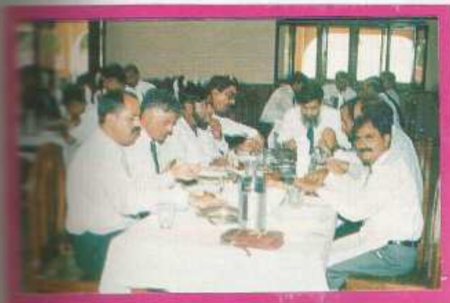
Guests in the New Mess