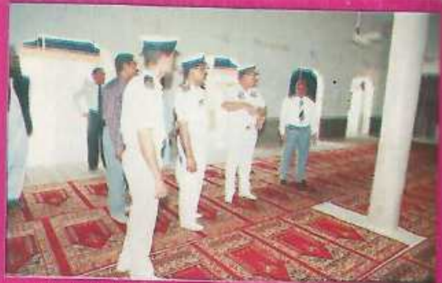
Former Chairman BOG, Visit the Mosque