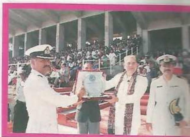
Principal presents the college crest to the Chief Guest on the Parents's Day