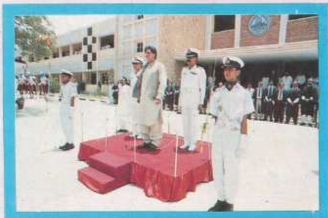
Receiving the guard of honour