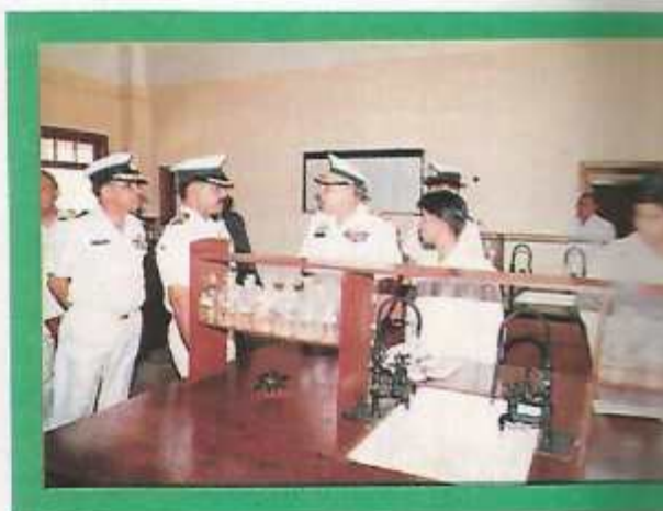
In the Chemistry Lab.