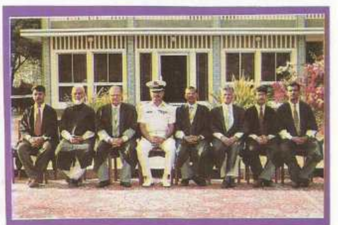
Department of Chemistry