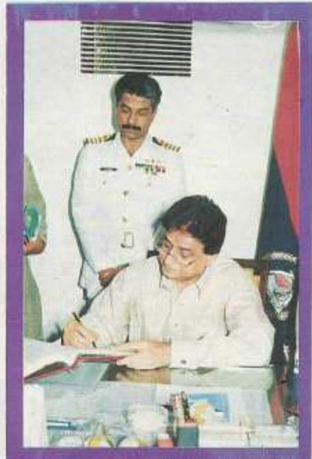
The Chief Minister writing his views in the Visitor's Book