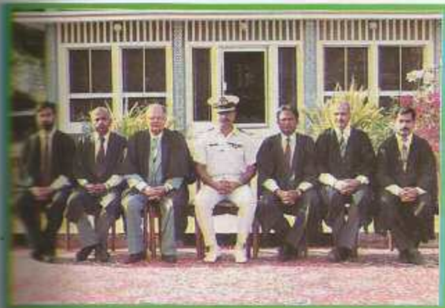
Department of Maths