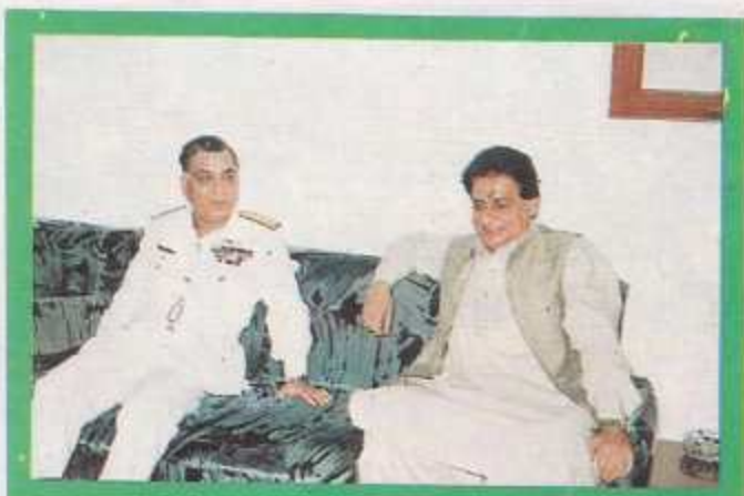
The Chief Guest and the Chairman in the Principal's Office