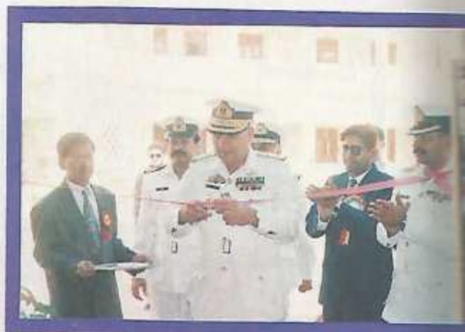
Inauguration of the exhibition