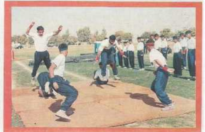
Cadets showing their skills in gymnastics