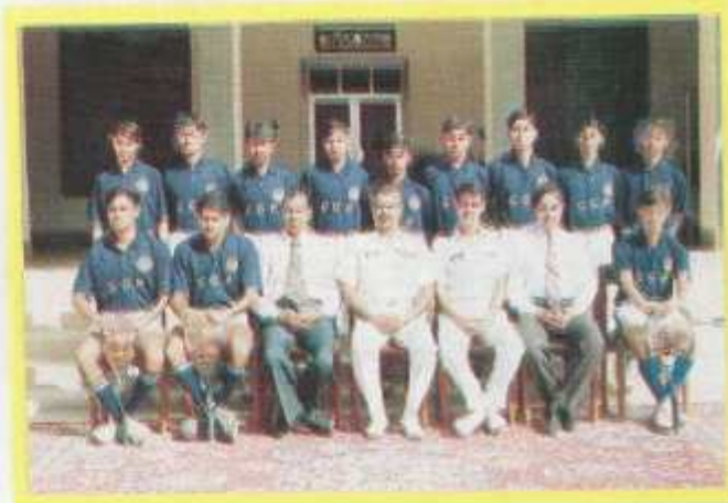
Tennis and Squash teams