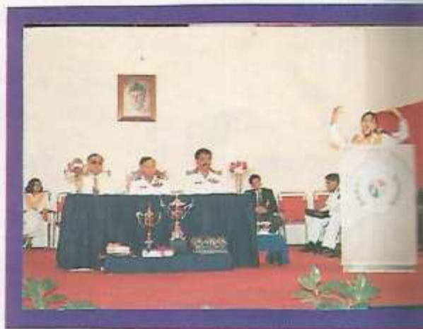
Declamation Contest in progress