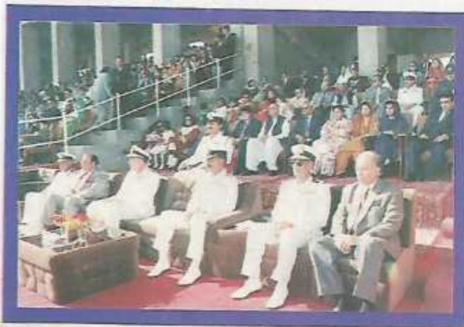
The Chief Guest and Parents on the Parent's Day