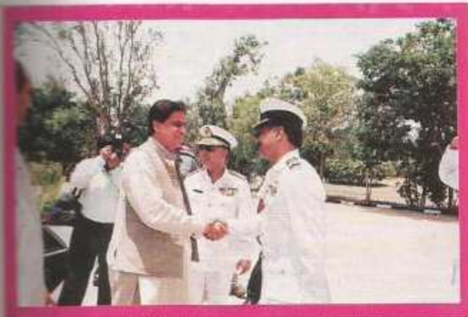
The Chief Minister being received by the Principal