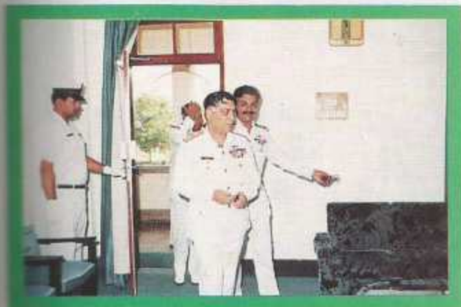
The Chairman B.O.G. entering the Principal's Office