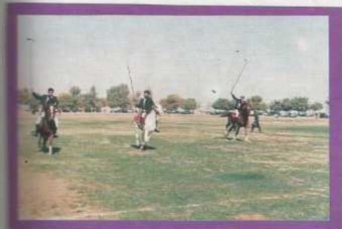
Tent-pegging in progress