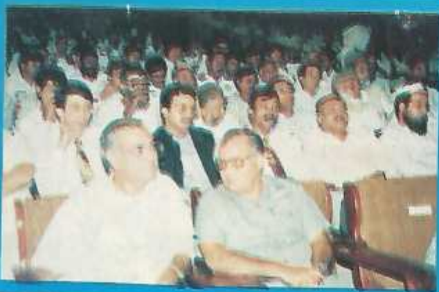
Audience listening the speakers