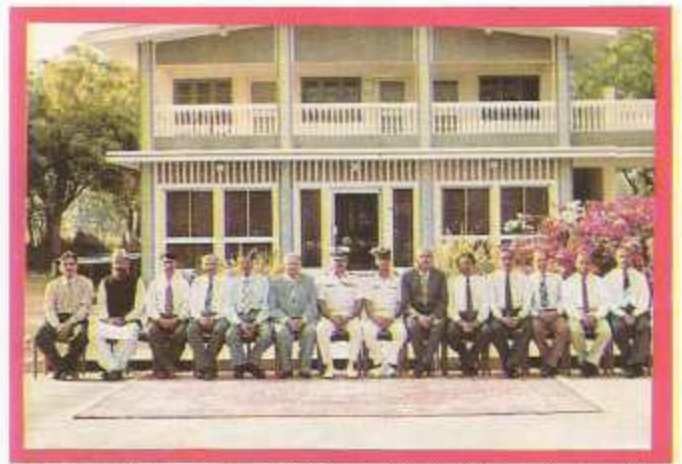
Principal Professors, Adjutant and Divisional Officers