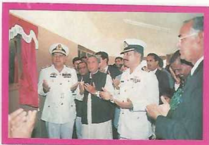
Inauguration of the New Cadet's Mess by the Former Chairman B.O.G, CCP