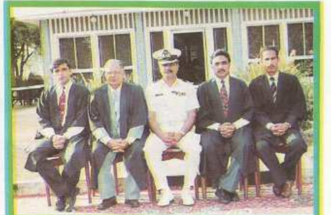
Department of Pakistan Studies