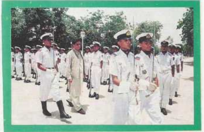
Chief Minister Inspecting the guard of honour