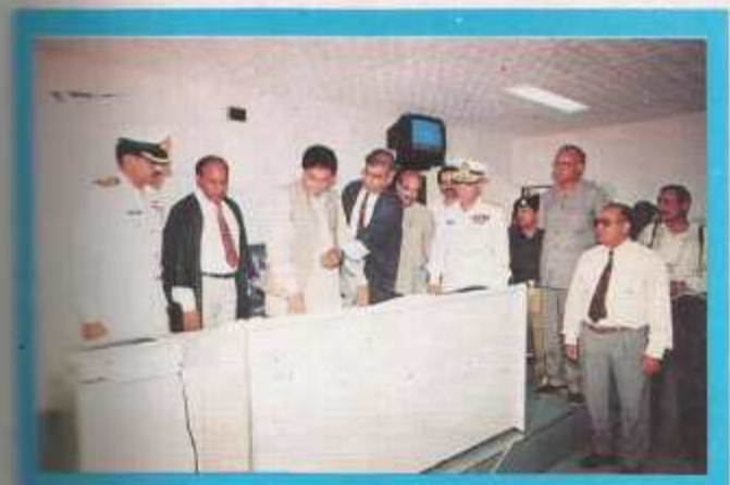
In the English Language Lab.