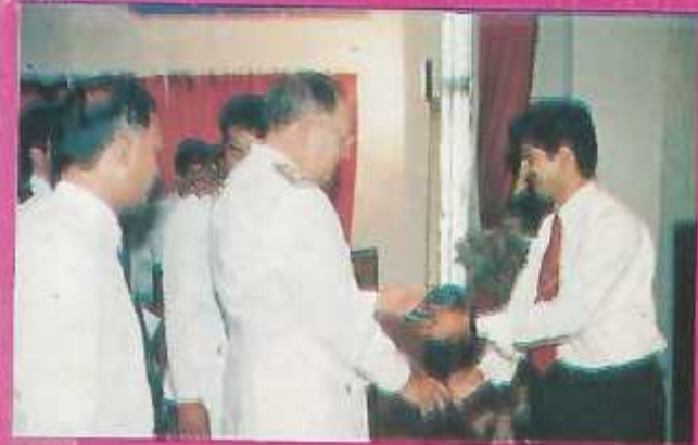
One of the teacher guests receives the crest