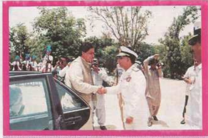
The Chief Guest being received by the Chairman Board of Governors, CCP.