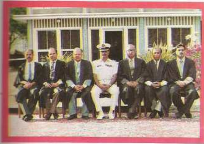
Department of Physics