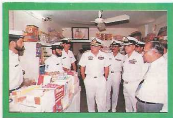
The College Canteen being inspected by the Former Chairman, B.O.G, CCP.