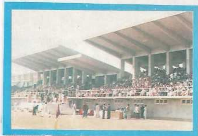
A view of the newly built Pavilion