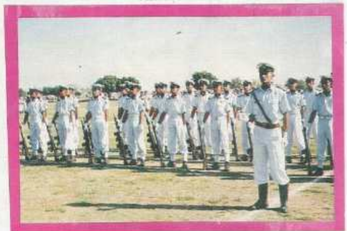
The Cadets standing at ease