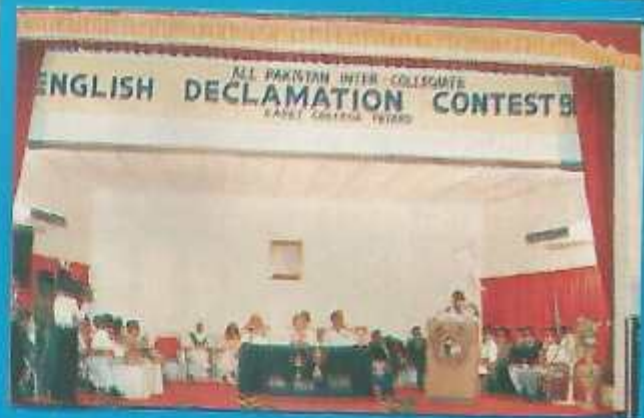
English Declamation contest in progress