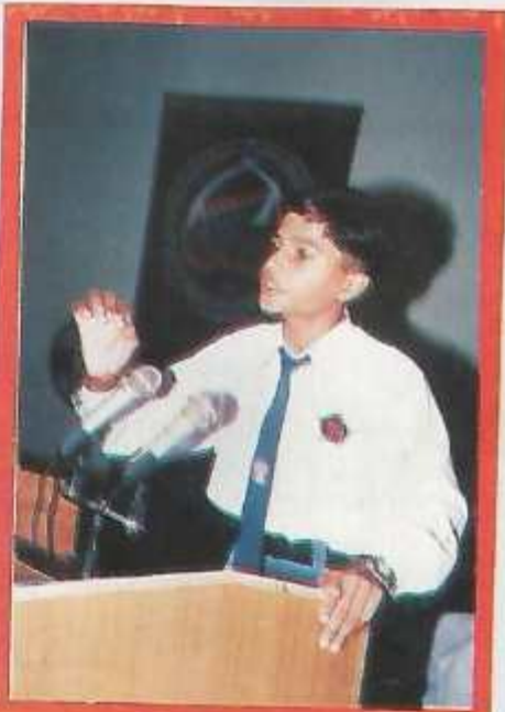
A boy speaker