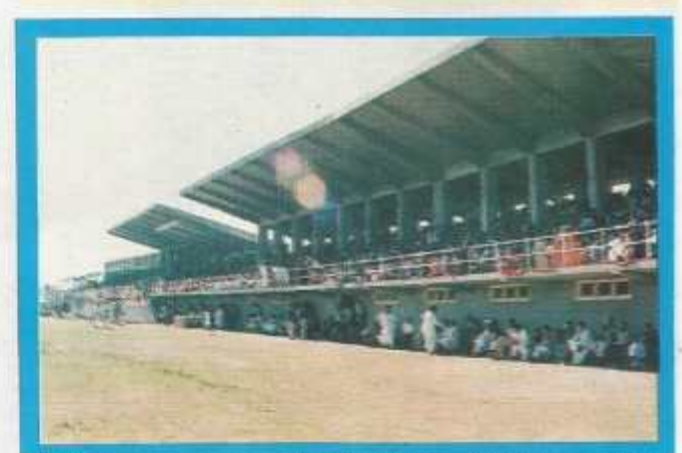
A view of the sports pavilion