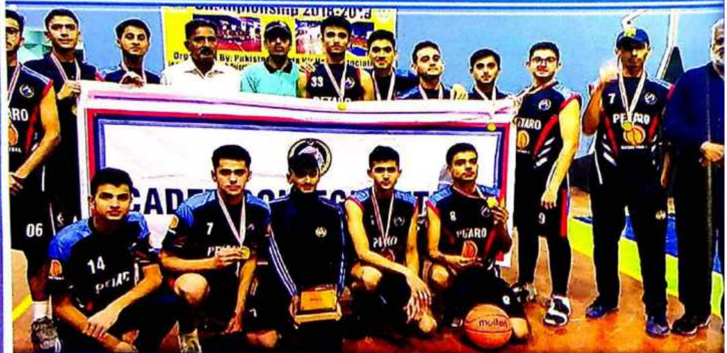
CCP Basketball Team at Sindh Agricultural University Tando Jam