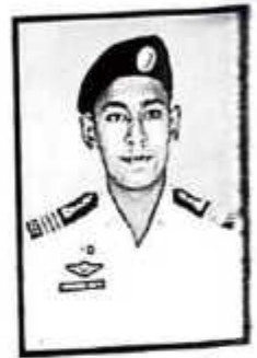
SLC Musadiq Shaham Kit No. 16071 (J)

In the modern era, use of internet is increasing day by day. It has become one of basic necessities of our society because it has made things easy and interesting for us. It is pertinent to mention here that where internet is useful at the same time it is destructive! It is a web which has grabbed human minds. Internet keeps entire globe in front of you, leaving altogether up to you how you explore and what you explore. Where it has facilitated education, business, trade, medicine, science, society; at the same time it has introduced several cybercrimes like hacking, hijacking, stealing, blackmailing, etc.