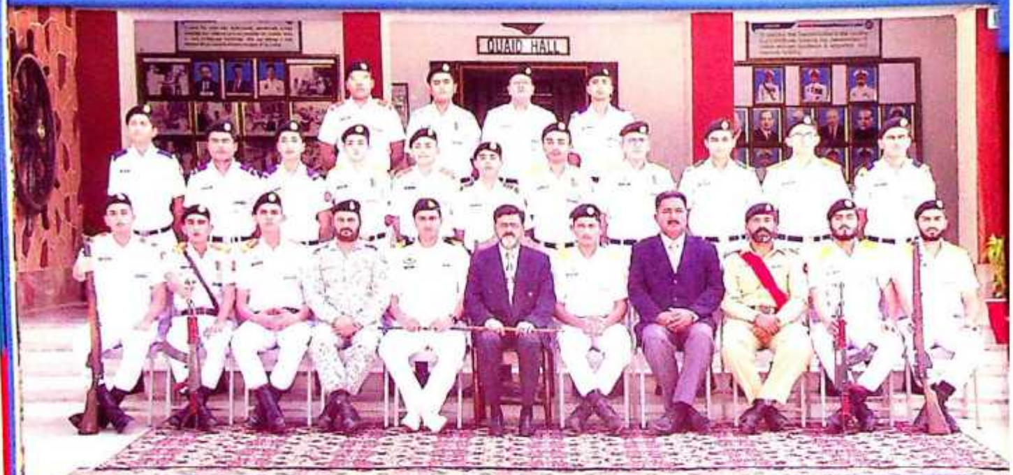
Outdoor Shooting Team