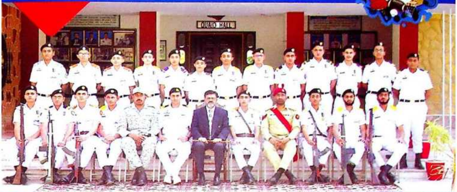
Indoor Shooting Team