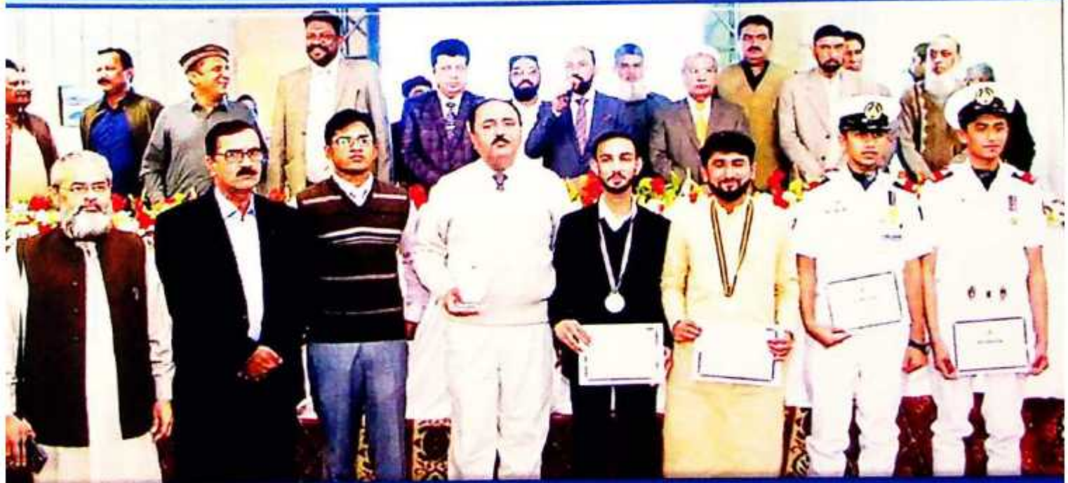
Group Photo of the Cadets, their Parents & Teachers during Medal Award Ceremony BISE Hyderabad